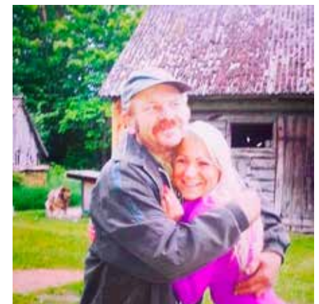
Mari ásamt líffræðilegum föður sínum, en hún hitti hann reglulega í heimsóknum sínum til Eistlands.

hér. Ég reyni að fara heim einu sinni á ári og hitti þá SOS fjölskylduna mína, ættingja og vini,“ segir þessi kraftmikla kona að lokum.