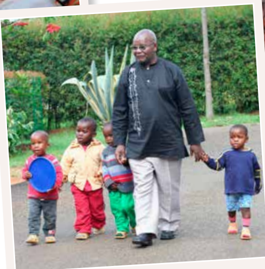
SOS faðir með börnum í Kenía