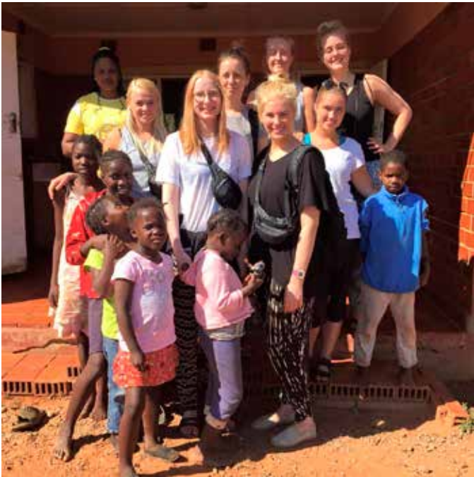
Hópmýnd fyrir utan eitt heimilið