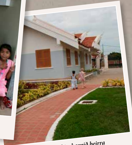
Dóttir Rakelar og styrktarbarnið þeirra að leiðast um þorpið