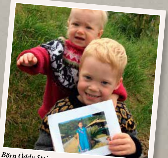
Börn Öddu Steinu

Systkinamyndataka. Það þriðja bættist í hópinn eftir jarðskjálftann í Nepal. Þegar við fréttum af skjálftanum var skrúfað niður í afmælisplönunum barnanna sem bæði áttu afmæli um það leyti. Í staðinn fyrir veislu og dýrar gjafir bættist þessi fallega stúlka við fjölskylduna og hefur gefið okkur svo mikið á þessum stutta tíma. Hlökkum til að fá að fylgja henni um ókomin ár. Takk fyrir okkur!