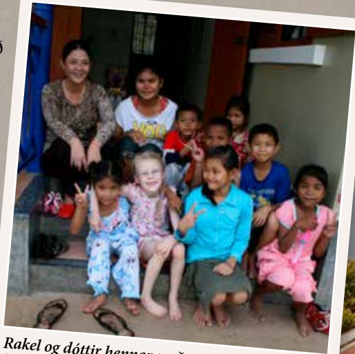
Rakel og dóttir hennar með SOS börnunum

Þetta er lítil upphæð fyrir mig, en breytir öllu fyrir hana.