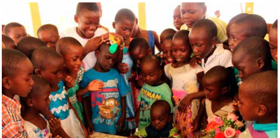
Afmælisveisla í SOS Barnaþorpinu í Yamoussoukro

kosinn forseti landsins en fyrrverandi forseti, Laurent Gbagbo, neitaði að fara frá völdum. Í kjölfarið braust út styrjöld með þeim afleiðingum að hundruð þúsunda þurftu að flýja heimili sín.