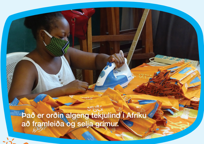
Það er orðin algeng tekjulind í Afríku að framleiða og selja grímur.

Það er sannarlega ástæða til að óttast, ekki síst vegna þess hversu veikbyggð heilbrigðiskerfin eru í þróunarlöndunum og efnahagur Afríku er heilt yfir brothættur og má ekki við miklum áföllum. Erfitt er fyrir Evrópubúa að setja sig í spor Afríkubúa. Tækni, samgöngur, menntun, rafmagn, heilsugæsla, aldurssamsetning og svo margt annað er afar ólíkt því sem þekkest á vesturlöndum.