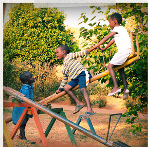
Börn að leik í SOS Barnahöfnunni í Mzuzu í Malaví.