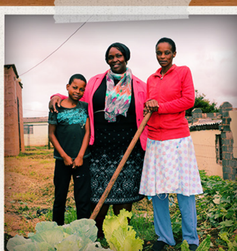
Skjólstaðingar fjölskylduefingar SOS í Pietermaritzburg í Suður-Afríku.