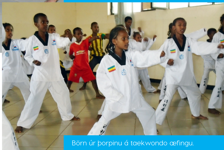
Börn úr þorpinu á taekwondo æfingu.