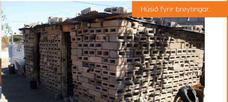
Húsið fyrir breytingar.