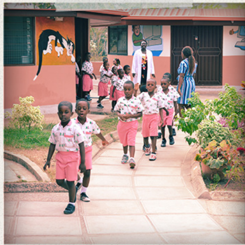
Börn að koma úr SOS leikskólanum í Tema í Ghana.