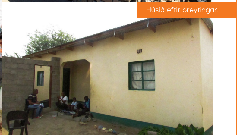
Húsið eftir breytingar.

SKJÓLVINIR GERA OKKUR KLEIFT AÐ SEGJA SVONA SÖGUR!