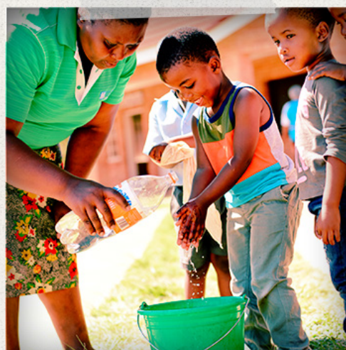
Börnin á SOS leikskólanum í Mhlangano í Svasilandi fá kennslu í handþvott.