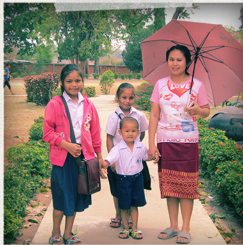
Móðir og börn í barnahöfnunni í Savannakhet í Laos.