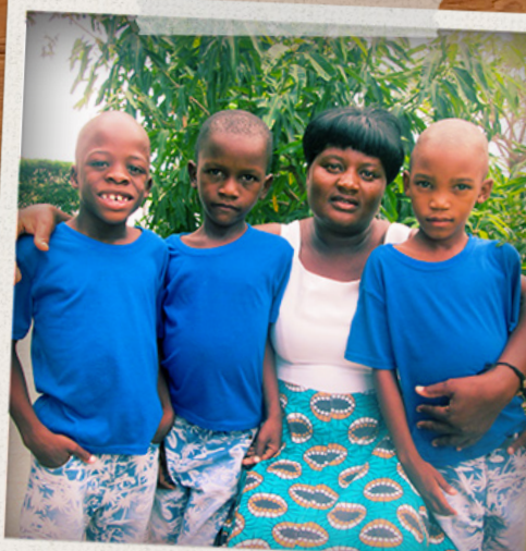
SOS móðir og strákararnir hennar í SOS Barnahorpinu í Ondangwa í Namibíu.