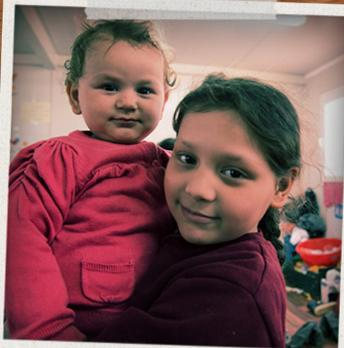
Afganskar systur á barnvænnu sveði SOS í Makedóníu.