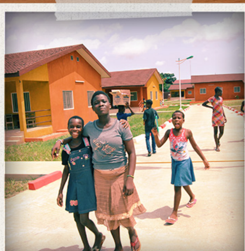
Á gangi í SOS Barnahorpinu í Yamoussoukro á Filabeinsströndinni.