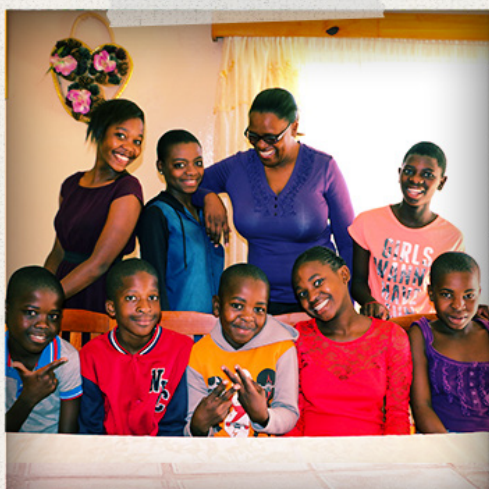
SOS fjölskylda í Mbabane í Svasilandi.