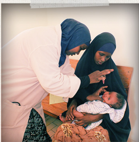
Heilsugæsla SOS í Mogadishu í Sómalíu.