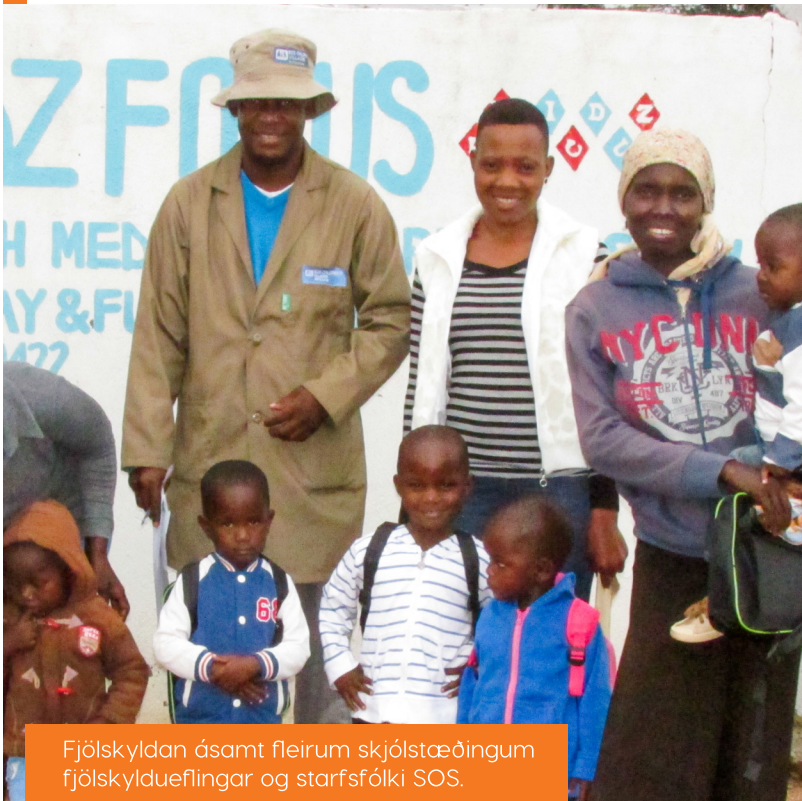
Fjölskyldan ásamt fleirum skjólstæðingum fjölskyldueflingar og starfsfólki SOS.

„Ég er þó bjartsýn og held áfram að leita að vinnu. Yngri krakkarnir eru að mennta sig og eru hamingjusöm, og það er fyrir öllu,“ segir þessi unga kona að lokum.