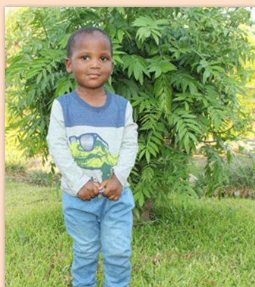
3 ára drengur í Simbabwe SOS-foreldri á Akureyri