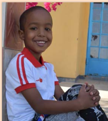
6 ára drengur í Sómalílandi SOS-foreldri í Mosfellsbæ