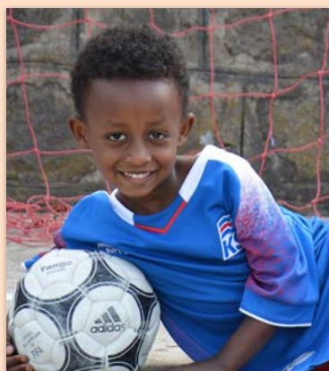
7 ára drengur í Eþíópíu SOS-foreldri í Reykjavík