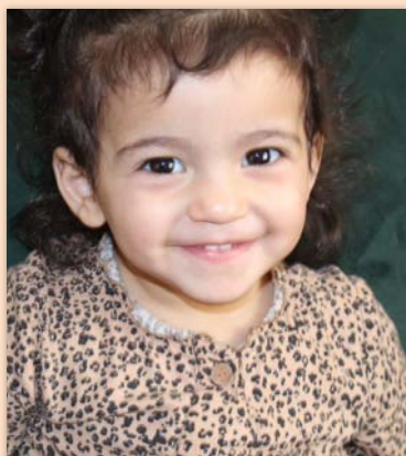
2 ára stúlka í Jórdaníu SOS-foreldri í Kópavogi