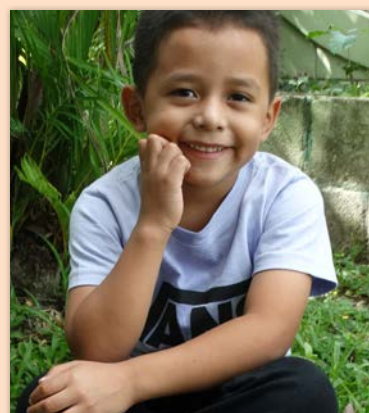
7 ára drengur í Hondúras SOS-foreldri í Reykhólahreppi