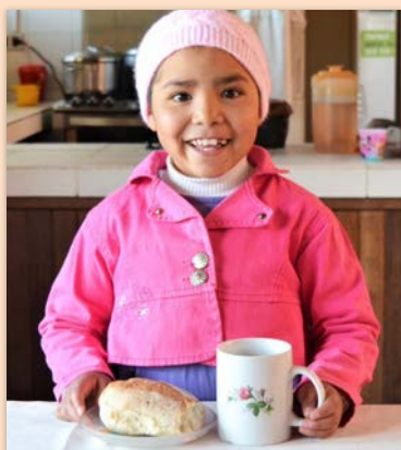
9 ára stúlka í Bólivíu SOS-foreldri á Akureyri