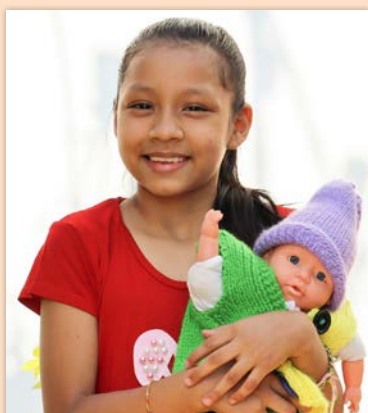
9 ára stúlka í Bólivíu SOS-foreldri á Þorlákshöfn