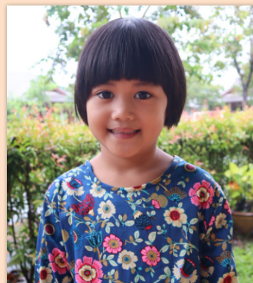
7 ára stúlka í Tælandi SOS-foreldri í Reykjavík