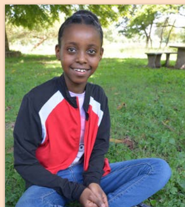
11 ára stúlka í Eþíópíu SOS-foreldri í Reykjavík