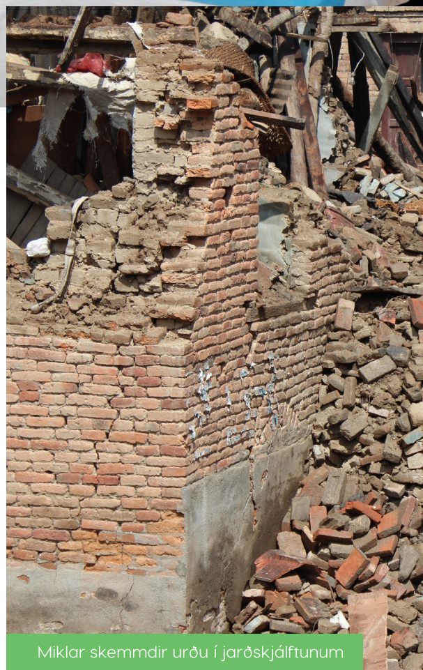
Miklar skemmdir urðu í jarðskjálftunum

SOS Barnaþorpin hafa starfað í Nepal frá árinu 1972 og eru með verkefni víðsvegar um landið. Í apríl á síðasta ári skók mannskæður jarðskjálfti landið og annar skjálfti fylgdi í maí á sama ári. 8.600 manns létu lífið vegna fyrri jarðskjálftans og 100.000 slösuðust. 500.000 fjölskyldur misstu heimili sín. Vegna langrar veru sinnar í landinu gátu SOS Barnaþorpin brugðist hratt við.