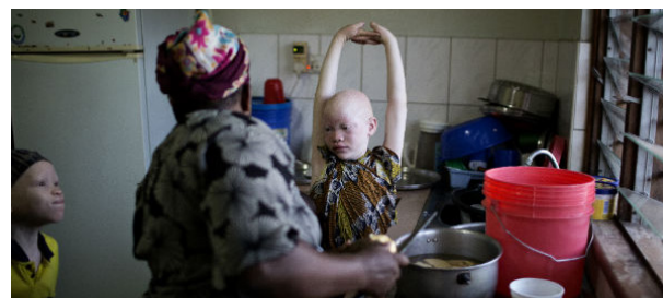
Á heimili sínu í SOS Barnaþorpinu

*Nöfnum barnanna hefur verið breytt vegna persónuverndar.