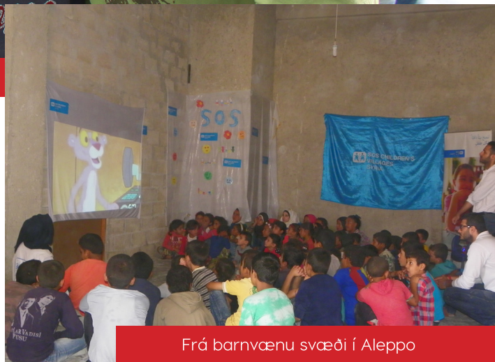
Frá barnvænu svæði í Aleppo

Íslendingar hafa verið afar duglegir að styrkja sýrlensk börn á vegum SOS. Fjöldi fólks hefur svarað kalli samtakanna um aukna aðstoð og í nóvember styrkti utanríkisráðuneytið neyðaraðstoð SOS í Sýrlandi um 15 milljónir króna en að auki leggja SOS Barnahorpin á Íslandi til þrjár milljónir í verkefnið. Alls verður framlag samtakanna því 18 milljónir króna.