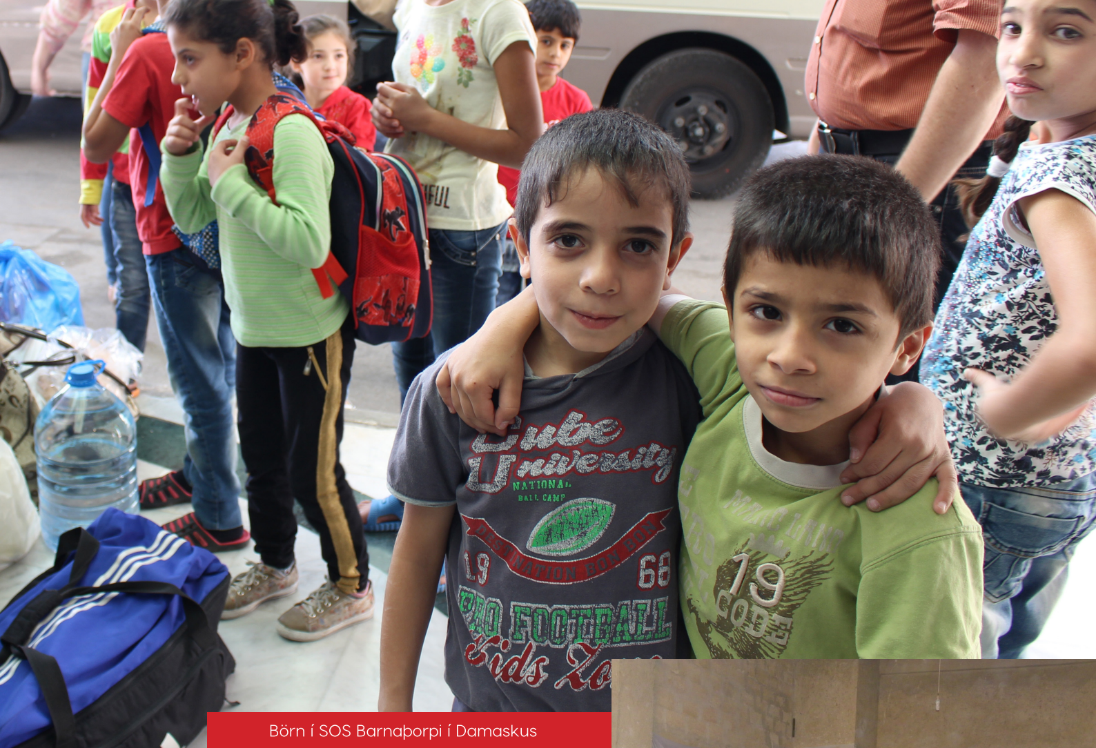
Börn í SOS Barnahorpi í Damaskus