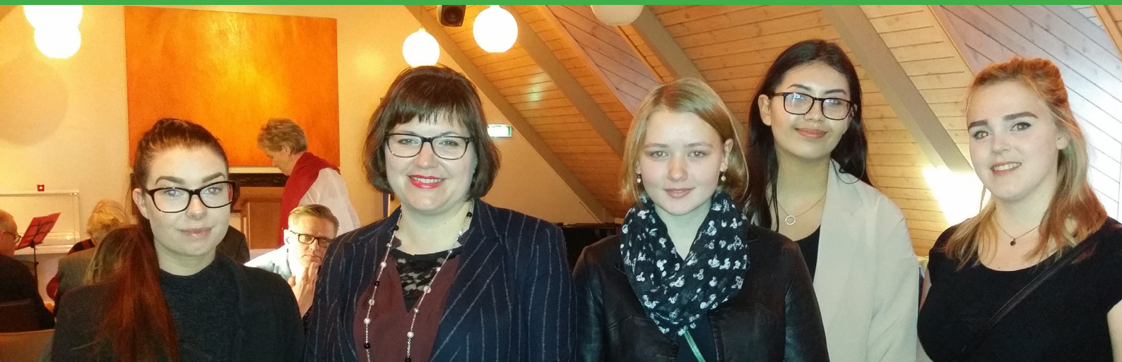
Hluti ungmennaráðsins ásamt forsetafrúnni við afhendingu fjölskylduviðurkenningar SOS Barnaborpanna

Ungmennaráðið er kærkomin viðbót við SOS Barnaborpin og starfsmenn eru spenntir fyrir að starfa meira með ráðinu í framtíðinni.