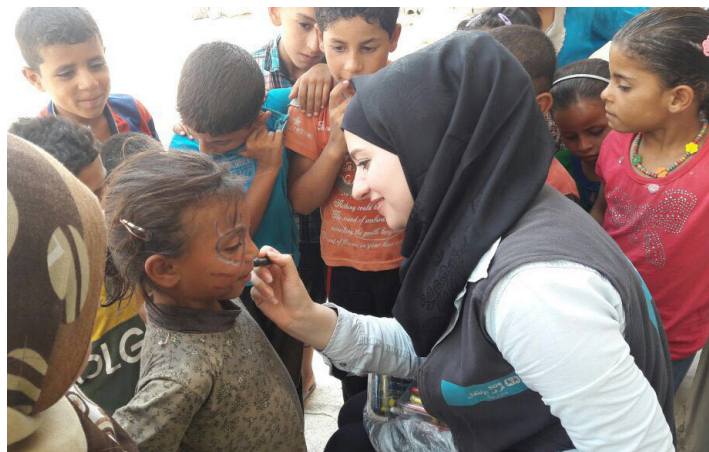
Starfsmaður SOS leikur við börn í Aleppo