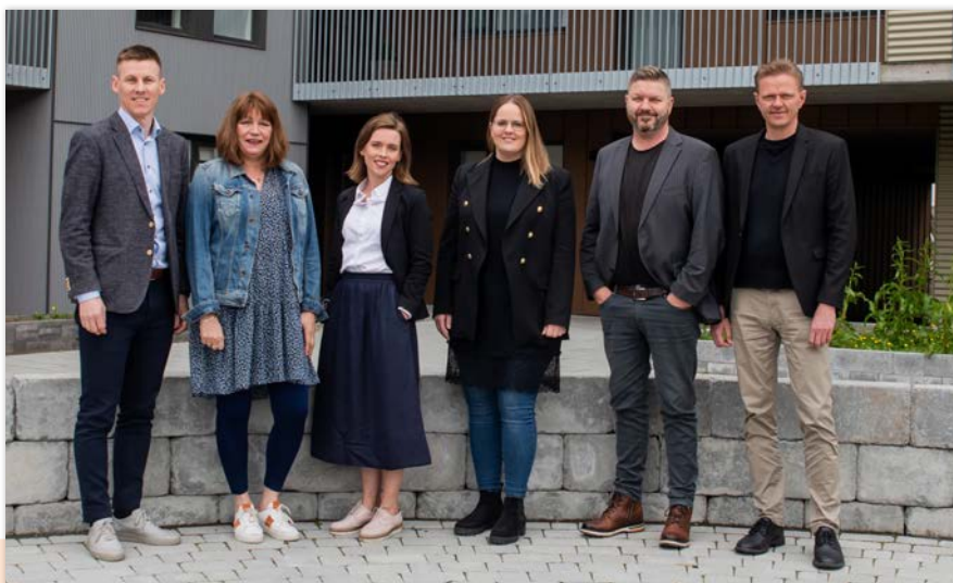
Verkefnisteymi SOS og Heimstaden á Íslandi.

Styrkur Heimstaden fjármagnar einnig þrjú erlend verkefni í þágu barna sem eru á ábyrgð SOS á Íslandi. Það eru atvinnuhjálp ungmenna í Sómalíu og Sómalílandi, baráttuverkefni gegn kynferðislegri misneytingu á börnum í Tógó og fjölskylduefningu í Rúanda.