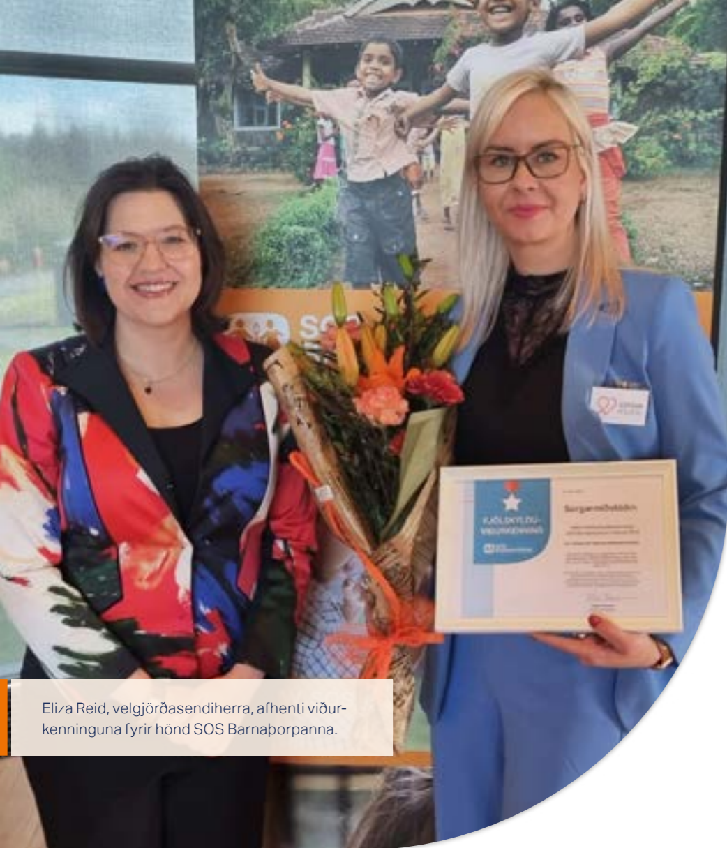
Eliza Reid, velgjörðasendiherra, afhenti viðurkenninguna fyrir hönd SOS Barnapörpanna.