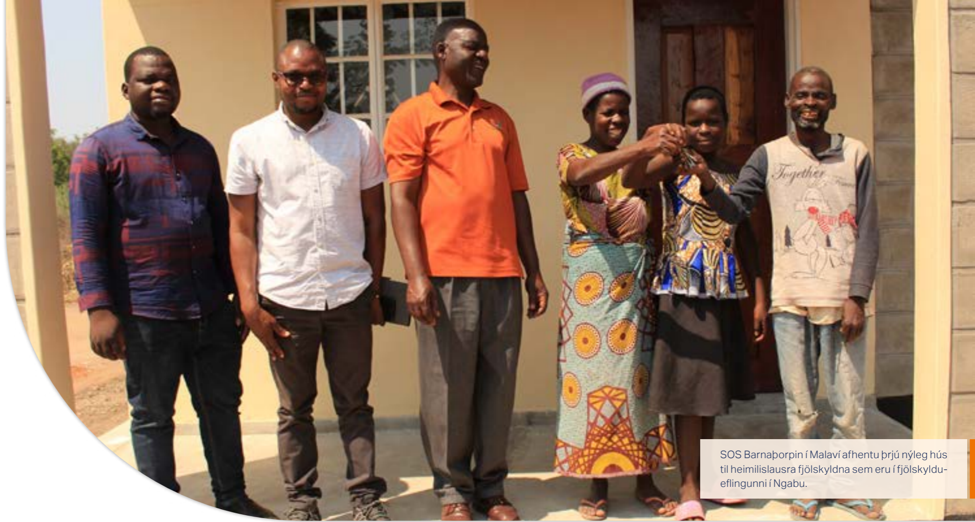
SOS Barnapörpin í Malaví afhentu þrjú nýleg hús til heimilislausra fjölskyldna sem eru í fjölskyldueflingunni í Ngabu.