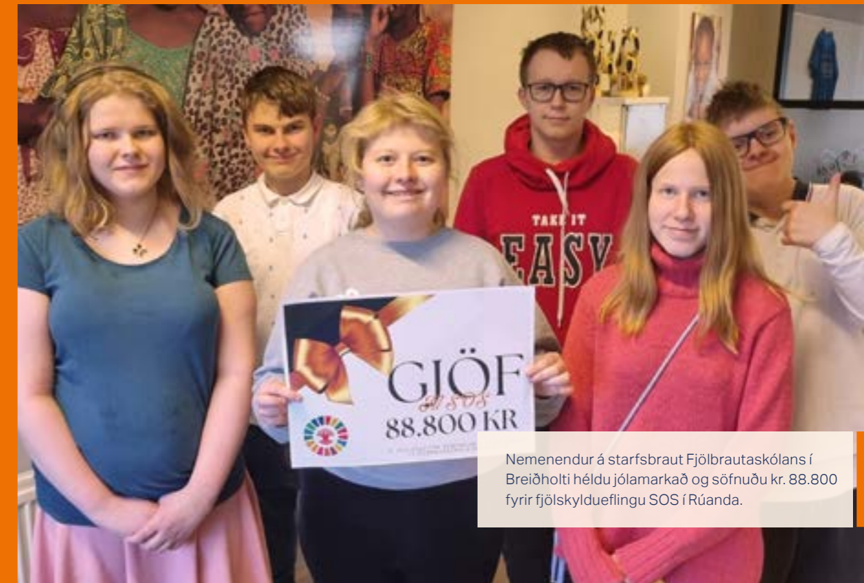
Nemenendur á starfsbraut Fjölbreyttaskólans í Breiðholti héldu jólamarkað og söfnuðu kr. 88.800 fyrir fjölskyldueflingu SOS í Rúanda.

Fræðslufulltrúi SOS Barnaþorpanna á Íslandi