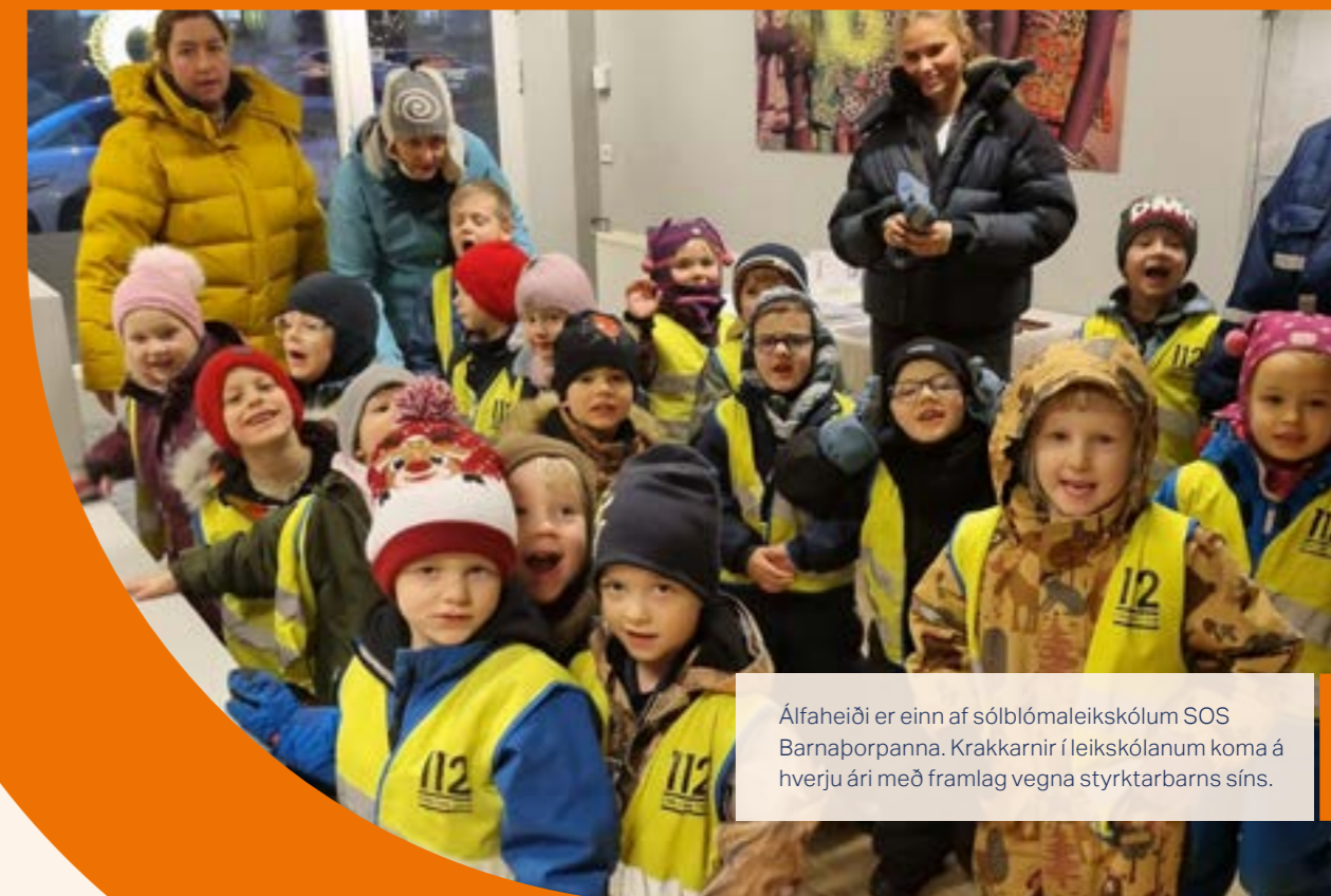
Álfaheiði er einn af sólblómaleikskólum SOS Barnaþorpanna. Krakarnir í leikskólanum koma á hverju ári með framlag vegna styrktarbarns síns.