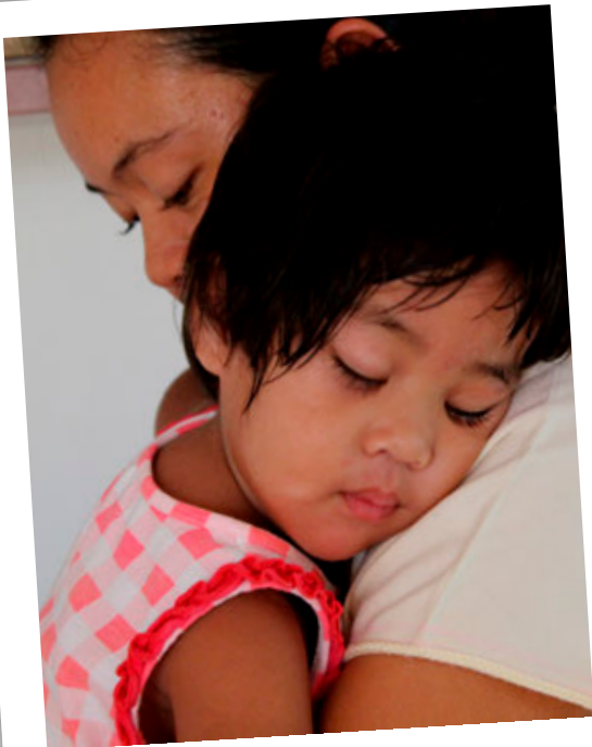
SOS mæðgur í Tælandi.