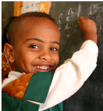
Nemandi í SOS leikskóla í Bahir Dar í Eþíópíu.

SOS leikskólarnir eru eins og aðrir leikskólar. Kennsluáðferðir SOS leikskólanna eru þó í anda uppeldisstefnu Friedrichs Fröbel og Mariu Montessori. Áhersla er lögð á að barnið fái að nota meðfædda hæfileika sína til sköpunar og hvert barn fær að þroskast á þeim hraða sem því hentar.