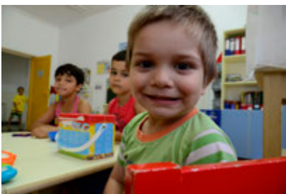
Frá SOS leikskólanum í Búkarest í Rúmeníu.

Venjulega sækja börn frá SOS Barnaþorpunum nærliggjandi leikskóla. Í löndum og á svæðum þar sem leikskólar eru ekki fyrir hendi eða eru metnir ófullnægjandi hafa SOS Barnaþorpin hins vegar byggt sína eigin leikskóla. Þessir leikskólar eru opnir börnum frá SOS þorpunum sem og öðrum börnum úr nágrenni þorpanna.