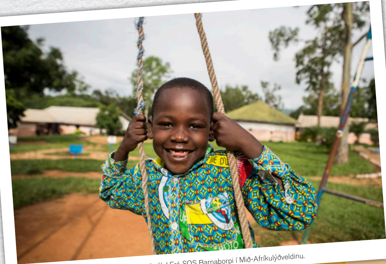
Það er gaman að róla! Frá SOS Barnaþorpi í Mið-Afríkulyðveldinu.