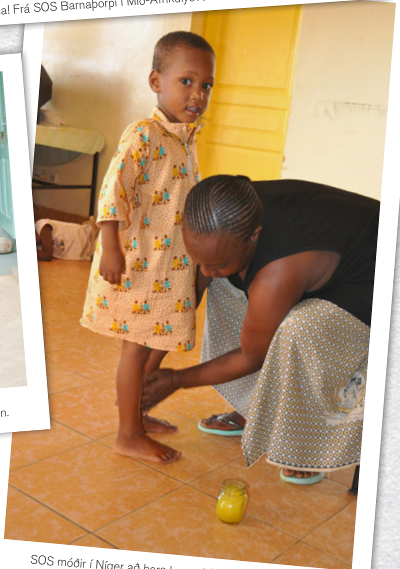
SOS móðir í Níger að bera krem á fætur dóttur sinnar.