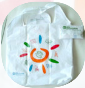
Umhverfisvænir plastpokar sem styrktaraðilar fengu sendan heim fyrir nokkrum vikum.