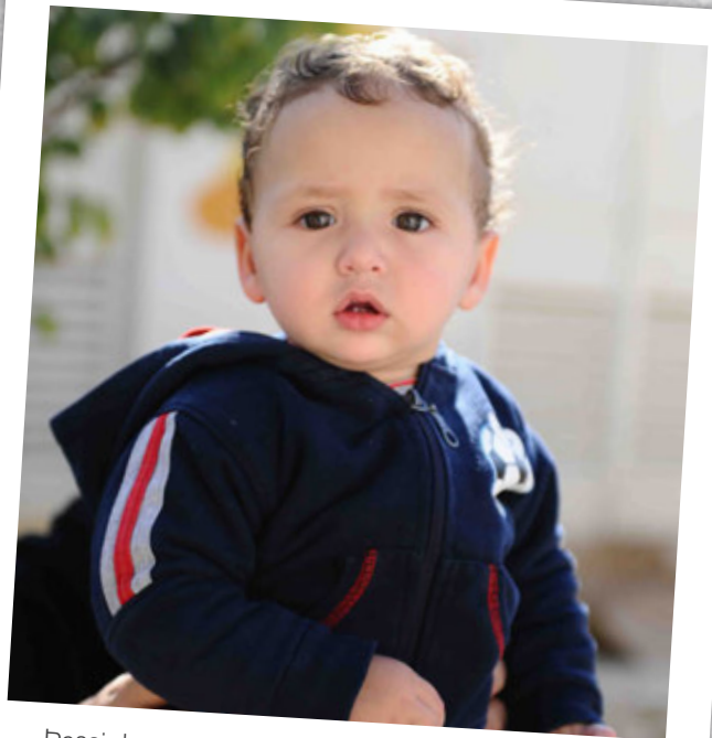
Þessi drengur fékk nýtt heimili í SOS Barnaborpi í Sýrlandi síðastliðið haust.

„Ég trúir því að heimurinn verði ekki jafn hættulegur á morgun ef við munum elska hvert annað örlítið meira en við gerum í dag.“ -Hermann Gmeiner.