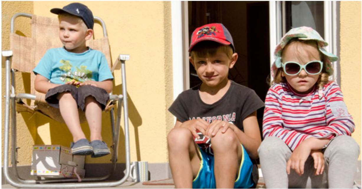
SOS systkini í Lettlandi.