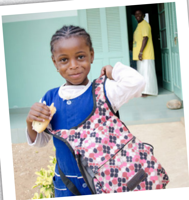
Stúlka í SOS Barnaþorpi í Senegal á leið í skólann.