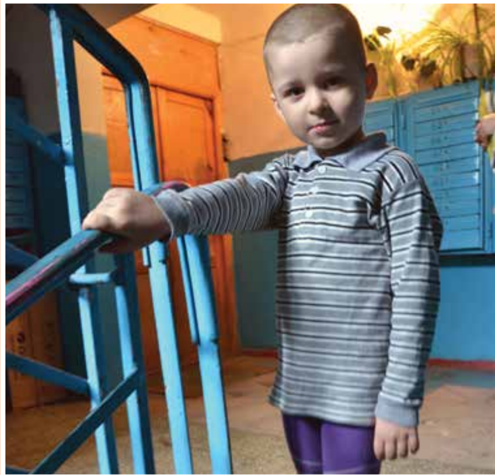
Drengur sem fær aðstoð hjá Fjölskylduefingu SOS í Lugansk.

Hún segir litla breytingu hafa orðið á lífi almennings í Lugansk þrátt fyrir vopnahlé. „Fólk á ekki pening og það er engin leið burt frá Úkraínu, nema