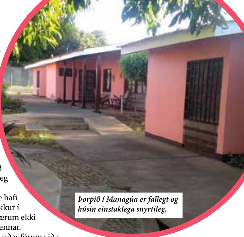
Þorpið í Managúa er fallegt og húsin einstaklega snyrtileg.