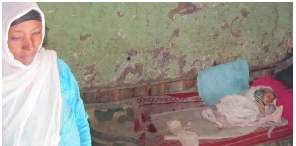
Nýfædd dóttir Sadije lá á skítugri dýnu á gólfinu inni í 10 fermetra húsi þessarar fimm manna fjölskyldu.

Hans Steinar Bjarnason Ritstjóri og upplýsingafultrúi SOS