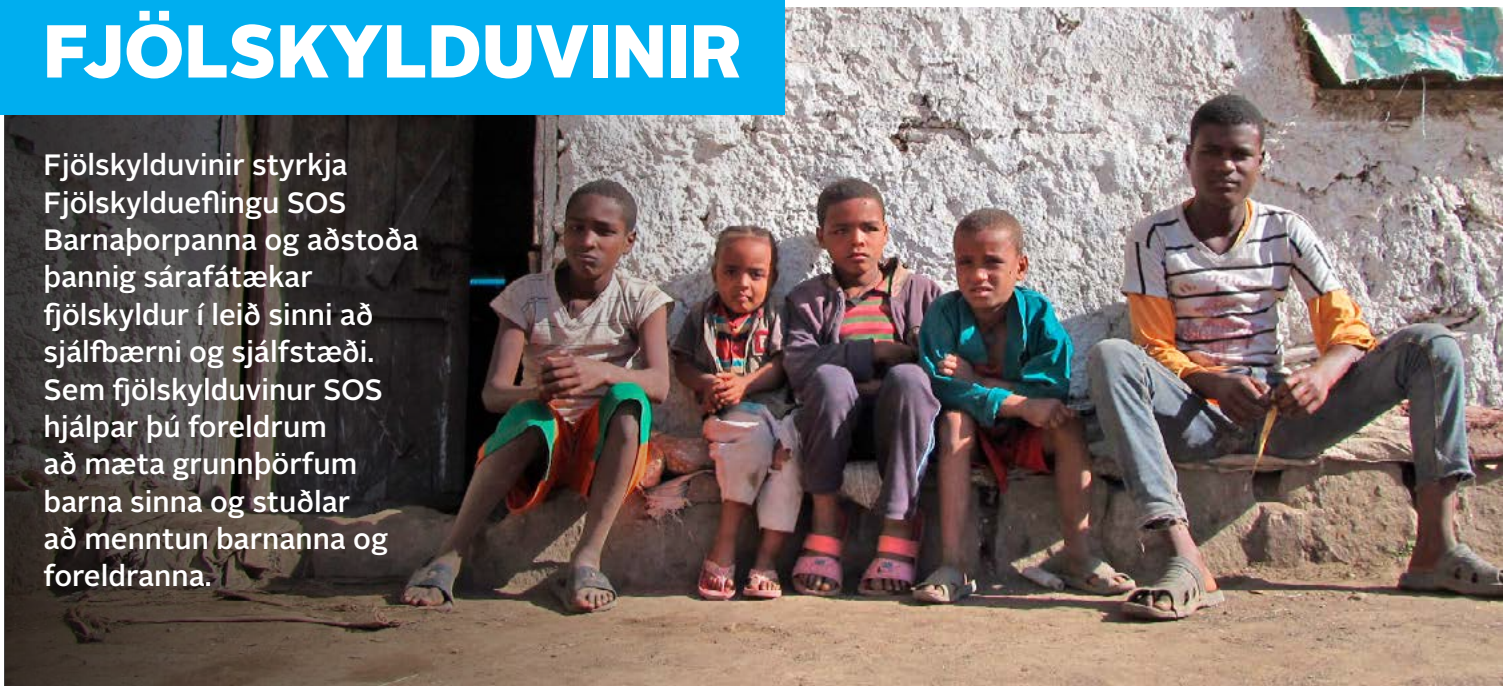
Þessi fimm systkini í Iteya í Eþíópíu eru ásamt foreldrum sínum í Fjölskyldueflingunni sem SOS á Íslandi fjármagnar.

Fjölskylduvinir styrkja Fjölskyldueflingu SOS Barnþorpanna og aðstoða þannig sárafátækar fjölskyldur í leið sinni að sjálfbærni og sjálfstæði. Sem fjölskylduvinur SOS hjálpar þú foreldrum að mæta grunnþörfum barna sinna og stuðlar að menntun barnanna og foreldranna.