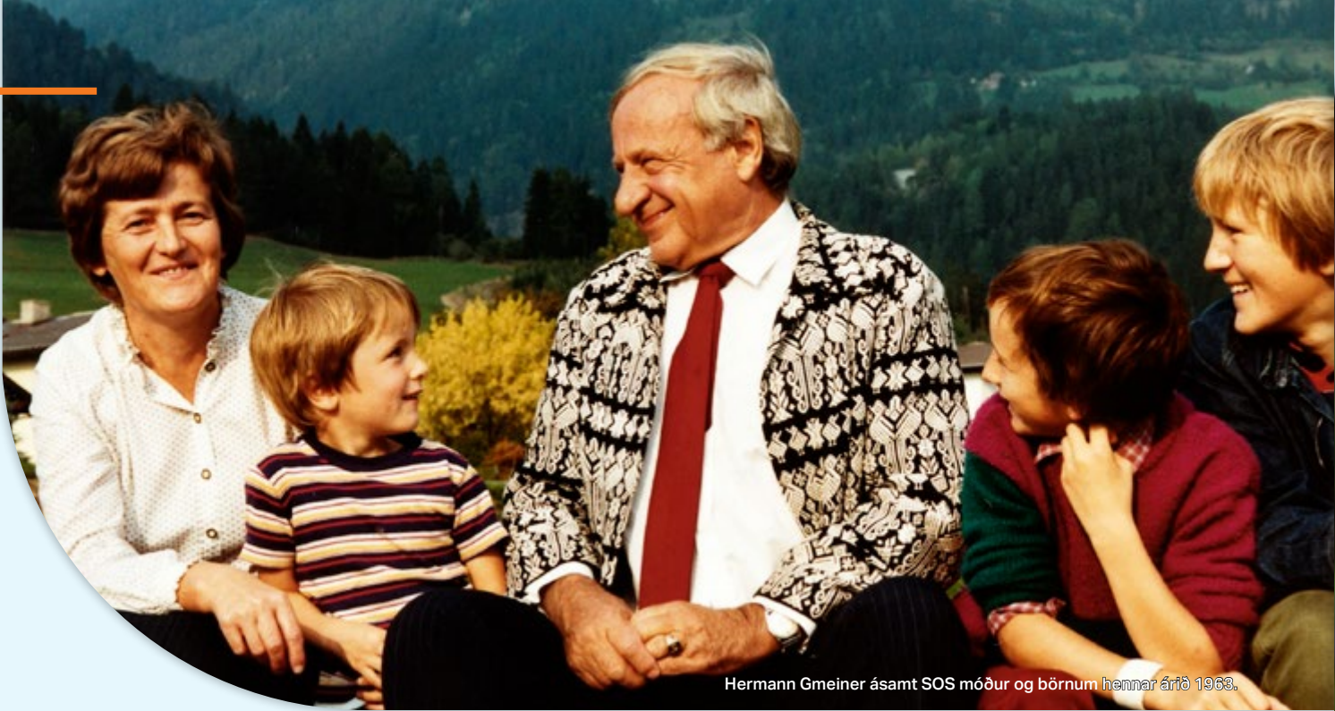
Hermann Gmeiner ásamt SOS móður og börnum hennar árið 1968.